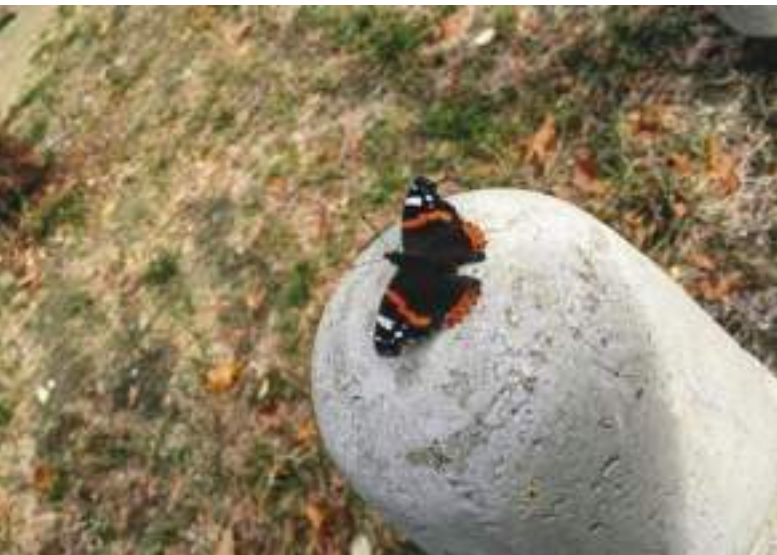
teodor____ Karpos, Karpoš, Macedonia